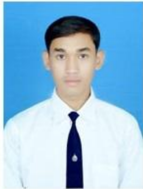
นักศึกษาชาย