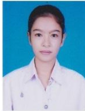
นักศึกษาหญิง