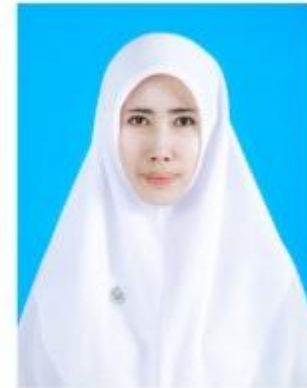
นักศึกษาหญิงมุสลิม

รูปถ่ายภาพสี หน้าตรง แต่งกายด้วยเครื่องแบบมหาวิทยาลัยฯ ไม่สวมหมวก ไม่สวมแว่นตาดำ